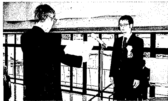
優良県営建設工事担当技術者会長顕彰

謝の意を述べながら 「これからも技術と技 能の向上に努め、建設 産業の文化を次世代に つなぐ一人の匠として 努力していきたい」と、 さらなる資質向上への 意欲を見せた。